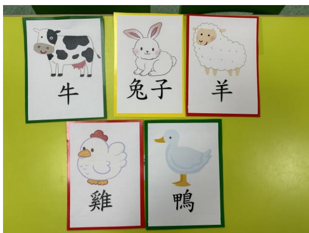
兔子、羊、牛、鴨、雞的字圖卡(B5 尺寸)