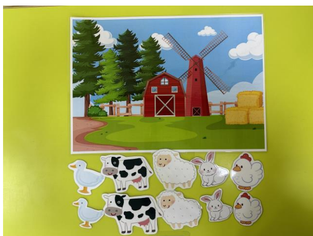
10 張動物圖卡及農場背景圖片(A3 尺寸)